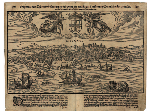
La Biblioteca Nacional de Portugal: Un viaje por el conocimiento