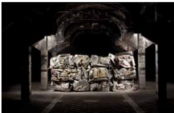
Síndrome de Guernica , Fernando Sánchez Castillo, Enero-mayo 2012.