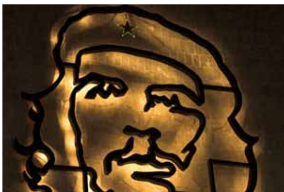
Imagen del Che Guevara. Plaza de la Revolución, La Habana, Cuba.