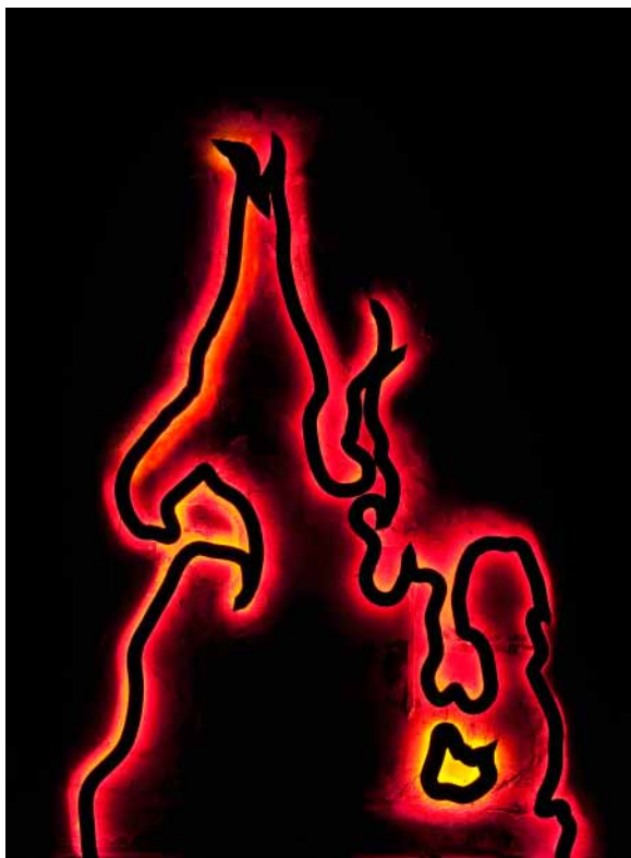
Candela. Imagen del montaje.