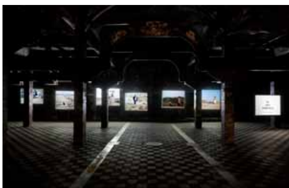
Prohibido cantar / No singing , Jordi Colomer, Septiembre-diciembre 2012.