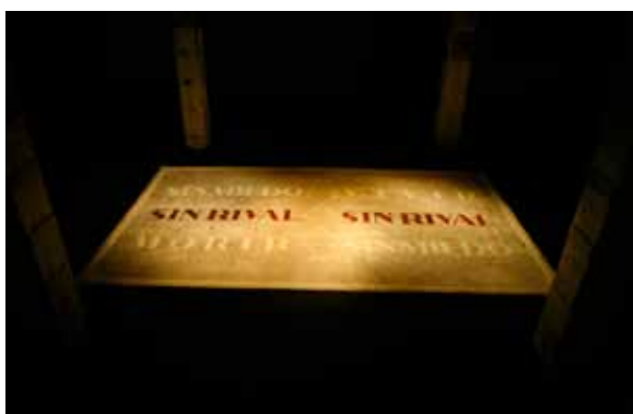
Fin e silencio , Carlos Garaicoa, Septiembre-noviembre 2010.