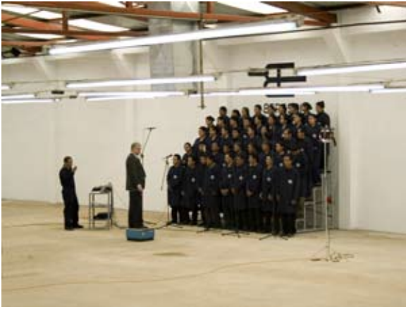
Risas enlatadas , 2009. Yoshua Okón.

hecho, esta región ha sido el centro de contrabando más importante desde la época de la Colonia y ello representa muchos intereses políticos y económicos.