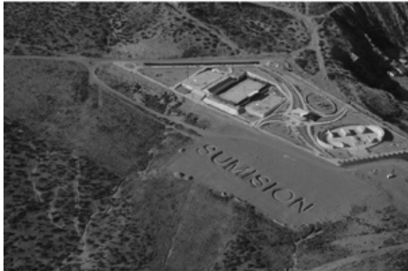
SUMISIÓN (Antes palabra de fuego), 2006-2007. Santiago Sierra.