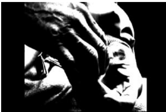
Y ahora... , 2008. René López