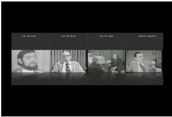
Códigos , 2009. Alfonso de la Cruz