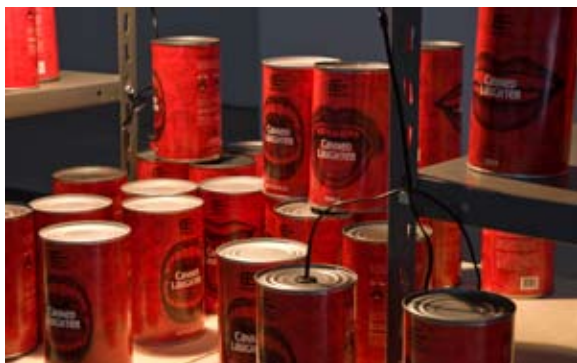
Risitas enlatadas , 2009. Yoshua Okón.