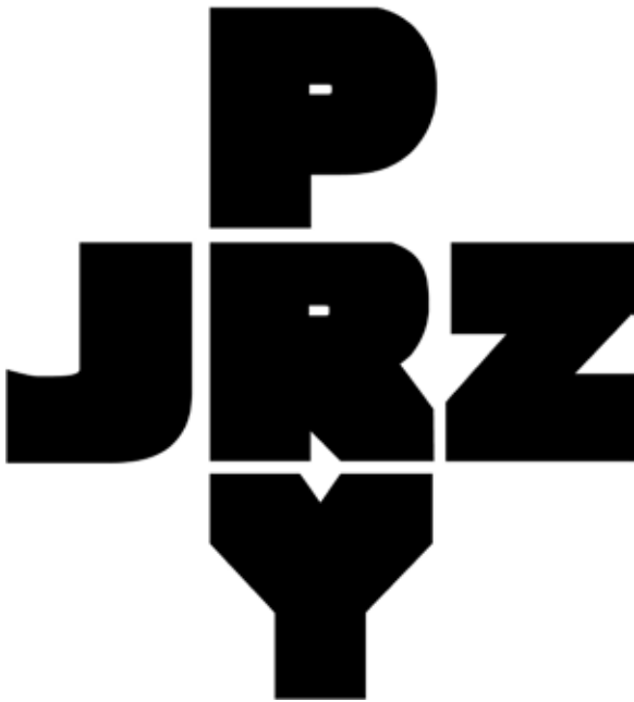
Logo para Proyecto Juárez, 2006. Carlos Amoraes.