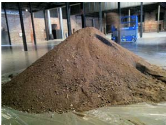
Sin título (retrato de mujeres en Juárez) , 2009. Artemio

Estado asesino / Libertad para los muertos , 2010. Democracia