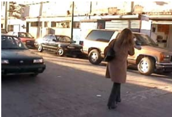
Callesnuff , 2003. Javier Ventura