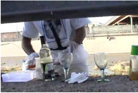
Cena romántica en la frontera, 2004. Manuel Mendoza

gares percibidos. Mi práctica artística es a veces un viaje hacia la comprensión de la topofilia o el lazo afectivo entre el individuo y el lugar. En algunos casos, es también una manifestación de una relación íntima con un desierto en particular, el que abarca Ciudad Juárez y sus alrededores. La instalación Micro Environments pretende ser una representación de la experiencia de este desierto al relacionarlo visualmente con imágenes de microbiología, y vista a través de la “lente” del agua. Al hacer esto, estoy reconciliando extremas fuerzas opuestas de la naturaleza, así como de escala y percepción (inmensidad y pequeñez, agua y tierra, desorientación y reconocimiento, estabilidad y cambio, etc.) Al imaginar estos encuentros en el desierto, me doy cuenta de cómo esta clase de lugares satisfacen no solo nuestros deseos escapistas pero también de que revelan en sí mismos, la relación que existe entre todo. Es al darnos cuenta de esto, que podemos alcanzar una experiencia de interconectividad y unidad con nuestros entornos.