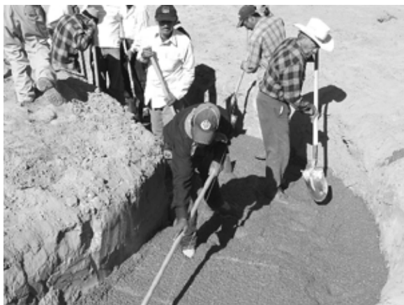
SUMISIÓN (Antes palabra de fuego), 2006-2007. Santiago Sierra.