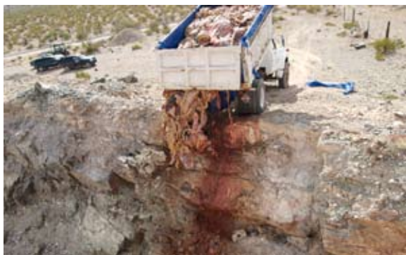
Seis metros cúbicos de materia orgánica (Homenaje) , 2009. Enrique Ježik