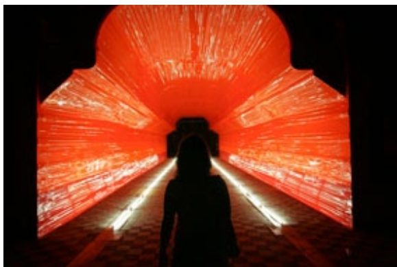
Potencial escultórico , 2010. Marlon de Azambuja.