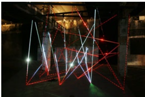
Fuegos Fatuos , 2010. Daniel Canogar.