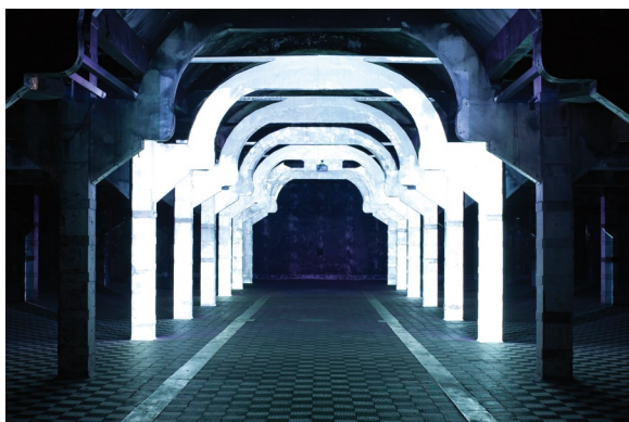
Quadratura , 2010. Pablo Valbuena.