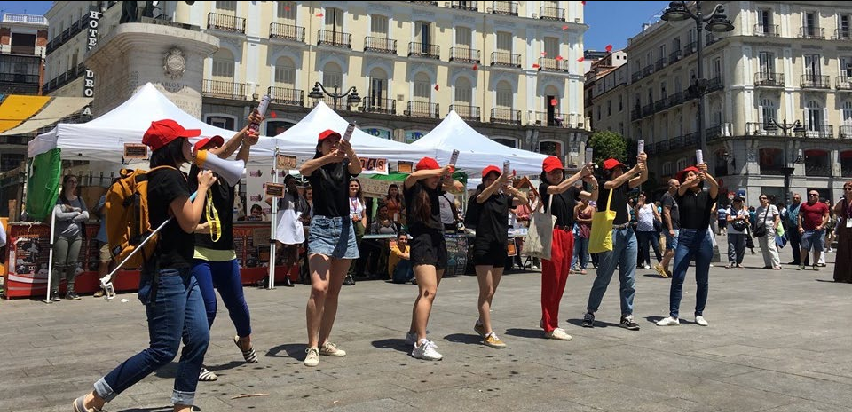
↑ Cangrejo Pro