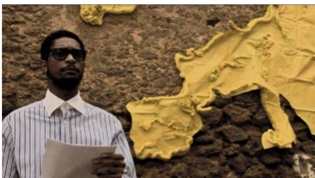
Nástio Mosquito. 3 Continents , 2010. Video still © Nástio Mosquito