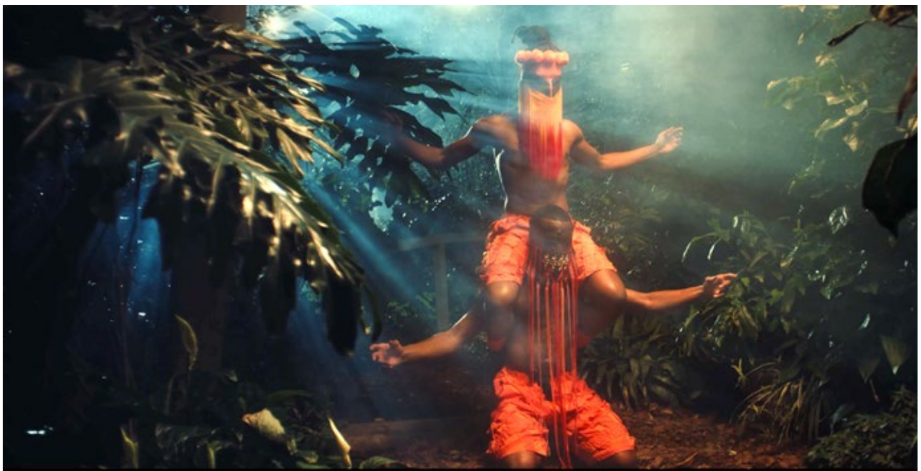
Julianknxx. Black Corporeal (Between This Air) , 2021.

According to Achiampong, 'The flags culminate icons moving towards unity and equilibrium. The work does not frame Pan Africanism as a utopian vision of the African continent, but one that considers aspects of responsibility in relation to the hidden tremors of history.' With this reflection in mind, Contra la Raza [Against Race] seeks to provide a space to cross time zones, geographic borders and ancestral generations —a call to action in order to foster a communal understanding of what cross-culturalism means today.