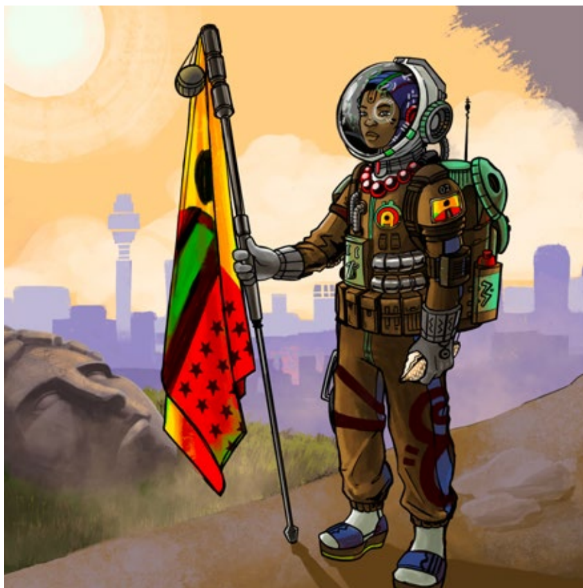
Larry Achiampong, Reliquary 2 , 2020. Character design and animation by Wumi Olakisibian © Larry Achiampong. Commissioned by John Hansard Gallery. Cortesía del artista and Copperfield, London

muchos. La ascendencia y las relaciones familiares son parte integrante del examen de las identidades poscoloniales que realiza el artista. Así, habiendo previamente revisitado recuerdos del pasado con su madre, esta pieza se proyecta deliberadamente hacia el futuro, estableciendo un nuevo diálogo con su progenie; un diálogo intergeneracional en el que las experiencias del presente se contemplan desde una perspectiva ausente históricamente en la forma de tratar los relatos de nuestros antepasados.