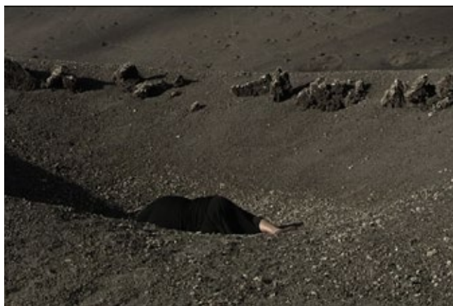
Berni Searle. Seeking Refuge , 2008. Fotograma. Cortesía del artista

Reliquary 2 es una meditación sobre un periodo de separación entre Achiampong y sus hijos, en el que el artista observa su propia narrativa familiar en el contexto pandémico y el trauma por el aislamiento forzoso durante estos tiempos sin precedentes. Hablando directamente a sus hijos, esta obra supone un testimonio poético y una labor de registro histórico, durante lo que ha sido un periodo distópico y desafiante para