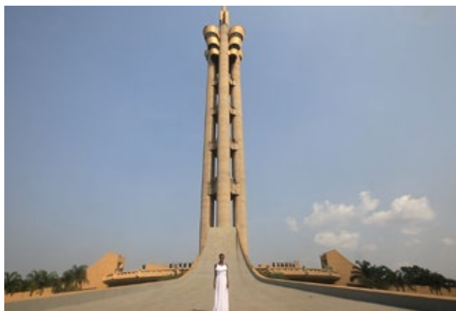
Mónica de Miranda. Beauty , 2018. Fotograma.