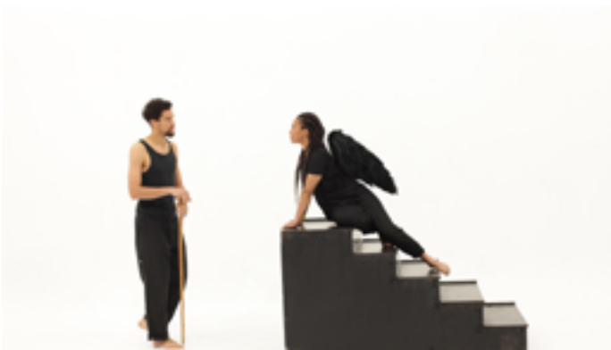
Ilusions: Vol 1. Narcissus and Echo . [Ilusiones: Vol 1. Narciso y Eco] Grada Kilomba, Portugal, 2017