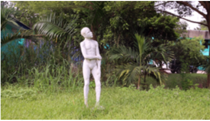
Beauty [Belleza] . Mónica de Miranda, Portugal, 2020