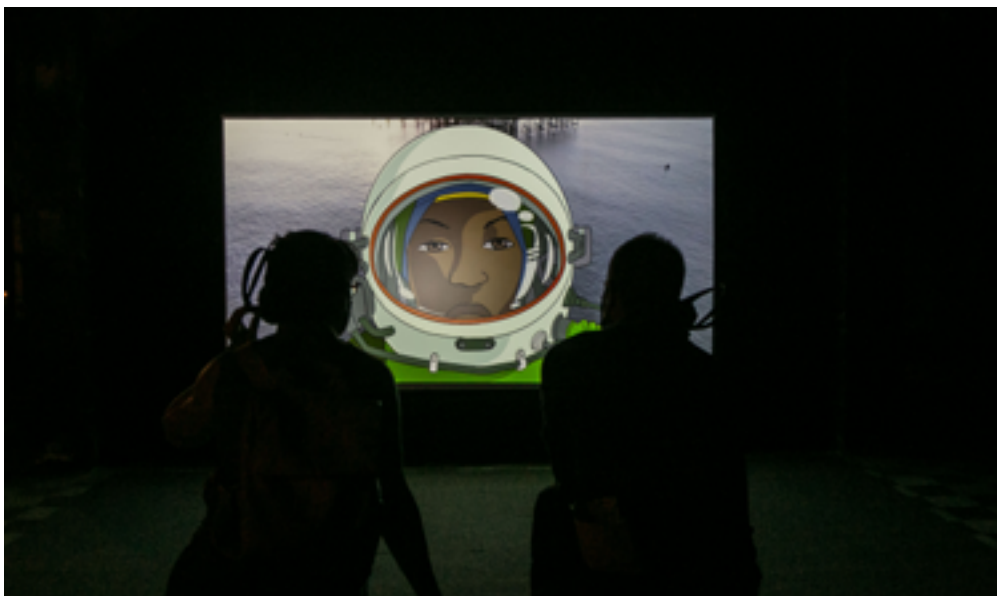
Larry Achiampong. Reliquary 2 , 2020. Cortesía del artista y Copperfield, Londres. Contra la Raza , vista de instalación, Matadero Madrid, 2021. Cortesía de Matadero Madrid y The Showroom, Londres. Foto: Lukasz Michalak

Por último, el programa presenta en dos sesiones, una el sábado 30 y una segunda el domingo 31, la performance SOUTH X SOUTH EAST a cargo de la artista londinense Belinda Zhawi , en la que combinando poesía y sonido indaga en el paisaje emocional de los jóvenes migrantes y en la construcción de la identidad a partir de lugares geográficos.