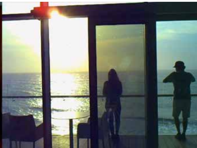
Durmiente , 2021 / async - first light , 2017