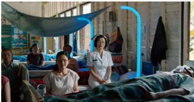
Cemetery of Splendour, 2015