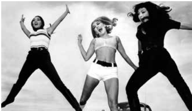
Faster, Pussycat! Kill! Kill! (Russ Meyer, EEUU, 2005)