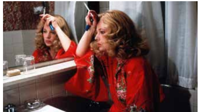
Noche de estreno (John Cassavetes, EEUU, 1977)