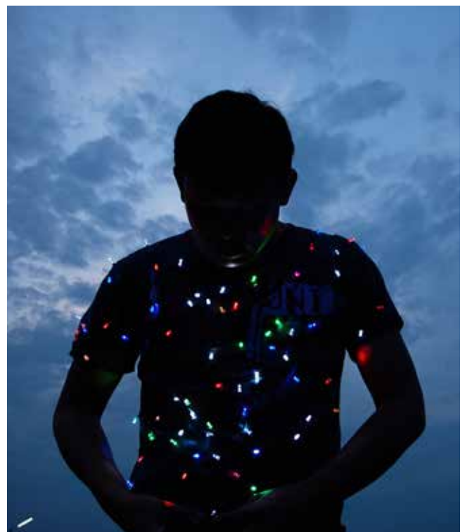
Power Boy (Villeurbanne), 2021

El Mekong marca la frontera entre el nordeste de Tailandia y Laos. La región está impregnada de la historia de ambos países, de las sucesivas migraciones y de las luchas políticas. En la confluencia de la memoria individual y colectiva, el río representa una línea de demarcación, un paso entre los muertos y los vivos. Esta dimensión histórica sustenta las obras creadas en Nabua y en el parque de esculturas Sala Keoku, dos lugares muy cercanos al Mekong.