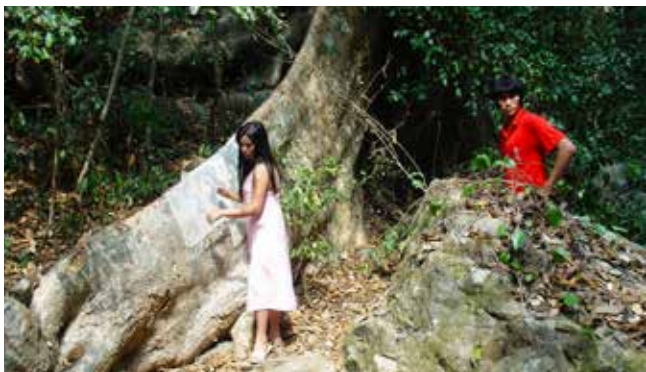
Worldly Desires, 2005