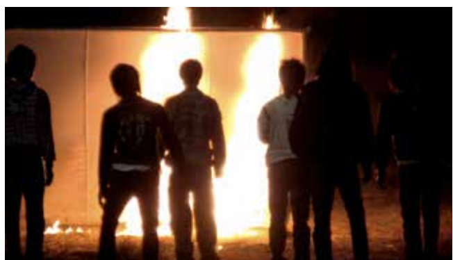
Phantoms of Nabua, 2009

I read somewhere that the idea of constant time doesn't exist in dreams. In case you find a clock in your dream, you'd see that the hands are moving erratically, or that the hands are not visible. But last night in my dream I stared at this clock that displayed the time properly – 3:40 pm. I was also aware of its little hand moving by the second. tick tick tick. I dreamt about a mixture of horror film and meditation. I was followed by an alien in an anonymous town. Even though it had big eyes it didn't really "see" me. It sensed me. When my mind went in different directions, this alien sensed the thoughts and appeared in front of me. The way to escape was to be mindful and focus on my breath. So in the whole dream I was trying to be mindful. I was among the a crowd who were walking uphill, in silhouettes. It was about awareness, yet I wasn't aware that I was dreaming.