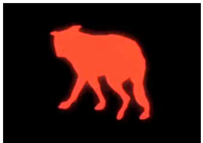
The Palace , 2007

Esta obra fue concebida para la exposición Discovering the Other que tuvo lugar en el Museo Nacional del Palacio de Taipéi, en Taiwán. Paseando por las calles de la ciudad, Apichatpong Weerasethakul quedó impresionado por la cantidad de perros abandonados, a los que él relaciona con espíritus. Por eso, tanto aquí como en Taipéi, el espacio expositivo opera como una máquina del tiempo que desdibuja la frontera entre animales reales y entidades invisibles. Realizados por un color rojo incandescente, los perros proyectados en el espacio se convierten en guardianes espectrales del lugar.