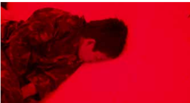
Haiku , 2009

En este contexto, los jóvenes construyeron una estructura circular, a medio camino entre una nave espacial y una máquina del tiempo, que se convirtió en un espacio para descansar y soñar. Haiku es un fragmento de esa nave, de ese espacio-tiempo que Weerasethakul consiguió crear con los adolescentes de Nabua; así como un environment teñido de la historia y el clima político de su país, que siempre está presente en su cine y que