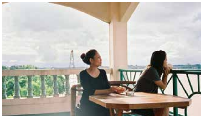
Mekong Hotel, 2012