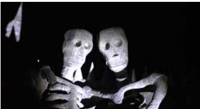
Fireworks (Archives) , 2014

Iluminados por los destellos intermitentes de unos fuegos artificiales, una pareja se pasea por este jardín nocturno, toman fotos, se aproximan el uno al otro y desaparecen. Entre los petardos y el interruptor de la cámara surgen otro tipo de disparos, acompañados de retratos fotográficos: rebeldes de la zona que fueron procesados y asesinados desde finales de 1940 hasta 1960.