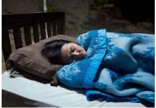
Blue , 2018

realización para el programa de creación digital de la Ópera de París 3e Scène, sumerge al espectador en algunos de los temas predilectos de Apichatpong Weerasethakul: la vigilia y el sueño, el onirismo, el insomnio y la capacidad evocadora de la luz.