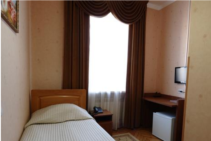
Espacio de residencias en Kronstadt